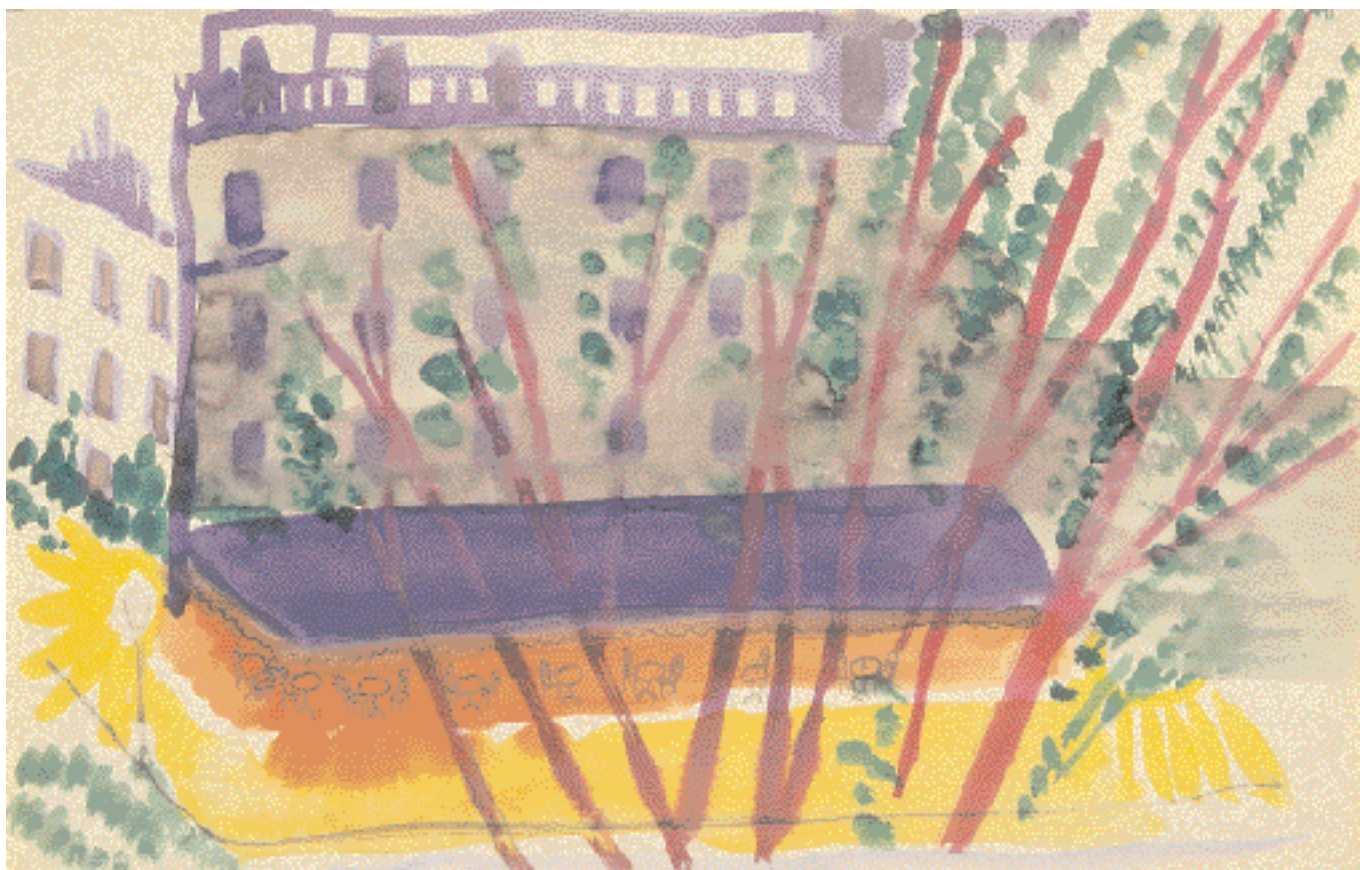
Párizsi kávéház – 1927 – akvarell, ceruza, papír 20 x 32 cm