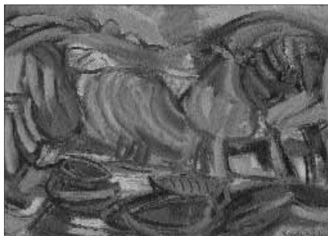
Romantikus táj – 1940 körül – olaj, karton, 43 x 61 cm

A harmincas évek festészetét kétféle, látszólag egymásnak ellentmondó tendencia jellemezte: a tiszta figurativitás és a tiszta absztrakció együttélése. Többször idézett 1927-es írásában a „természet teljes kikapcsolását a művészi ábrázolásból” egyelőre nem tette magáévá, ezzel egyidejűleg minden művészetre vonatkozó dogmatikus megállapítást elutasított. 1935-ös feljegyzé-