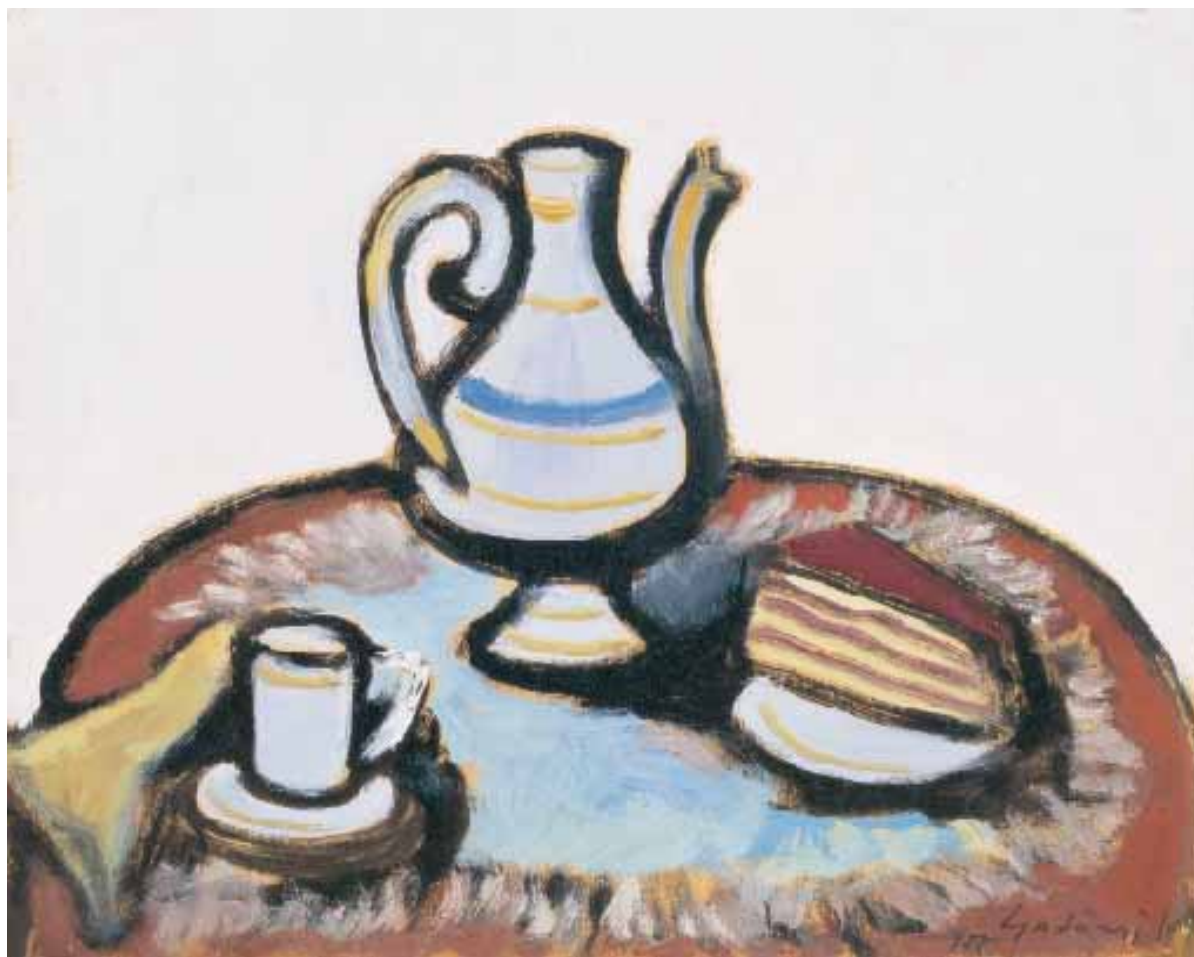
Uzsonna – 1955 – olaj, karton, 26 x 32 cm