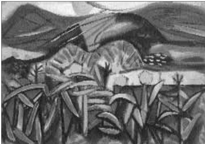
Dombos táj kukoricával – 1949 körül – olaj, karton, 30 x 43 cm

nek tökéletes példája. Mintha 1927-ben vallott művészeti nézetei, – „...a mi végtelenségünk bekapcsolódik a világ végtelenségébe” – teljesedtek volna be. Az ijesztő méretűvé növelt szürreális vízióvá alakult kukoricarostok uralkodnak a mögöttes tájon, házakon, megfordítva ezáltal a természet valóságos relációit. A képi feszültséget továbbfokozza a „ritmikus kolorit és a konstruktív képszerkesztés” ellentétes viszonya. 9 Ugyanakkor az 1948-49-es év során készült karakteres konstruktív, kubisztikus csendéletek, tájképek sora, melyek a színes, dekoratív csendéletek folytatásait jelentik, hozzájárultak Gadányi organikus festészetének kialakításához. A műfaji átjárhatóság, a csendélet és táj együtt szerepeltetése jellemzi ezeket a műveket. A csendélet kellékei a tájban, a kinn és a benn (Interieur-extérieur 1949) szimultán ábrázolása, éppúgy a makro- és mikrokozmosz egymásra hatásának felel meg. Az ötvenes években visszafogottabb színezésben, puhább körvonalakban tovább készültek ezek a kubista-szürrealista kompozíciók. Gadányi művészetében mindvégig megőrizte a kubizmus emlékét, többek között mesterségesen alakított tájkivágatai is ezt bizonyítják. Picasso mindig megújuló, a formai kategorizálásnak ellenálló művészete példaértékű lehetett számára. Nemcsak művészi magatartásában, de formailag is hatott rá. A kubista szürrealista csendéleti-tájak mellett az ötvenes években festett tengerparton merengő, távolba révedő súlyos női alakok, múzsák, klasszikus szépségű lovak,