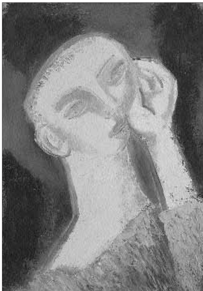
Támaszkodó – 1950 körül – olaj, karton, 43 x 30 cm