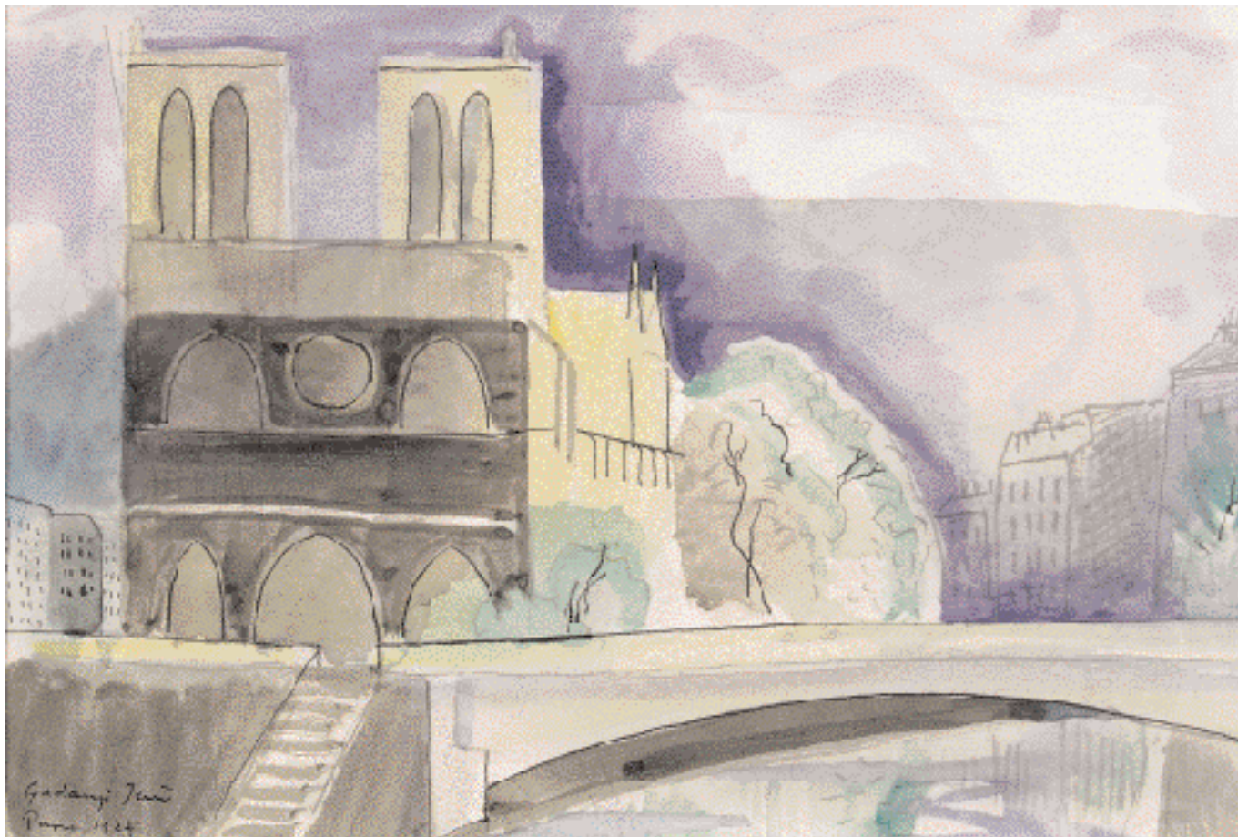
Notre Dame – 1927 – akvarell, tus, papír, 28 x 40 cm