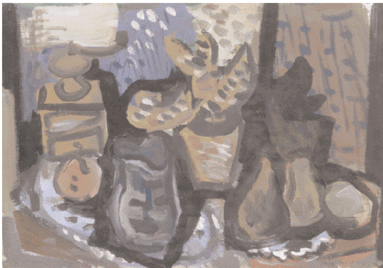
Csendélet kávédarálóval – 1939 – tempera, papír, 43 x 61,5 cm