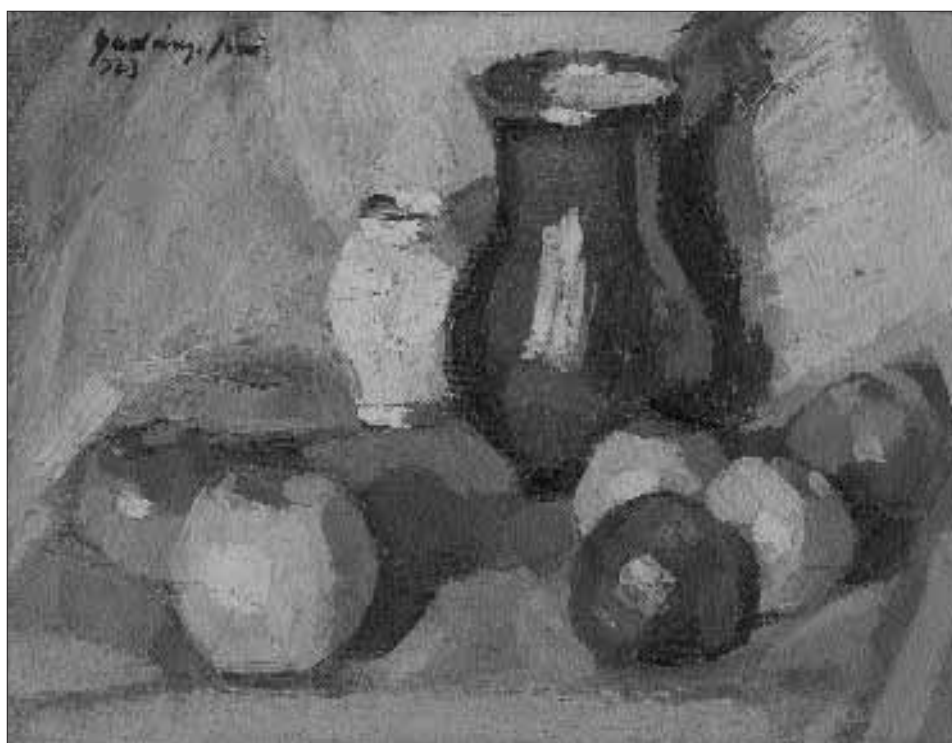
Csendélet vázával, almákkal – 1923 – olaj, vászon, 29 x 40 cm

Talán nem túlzás ennek a festői szemléletnek egyenes folytatását az 1947-48 körül kezdődő képek sorozá-