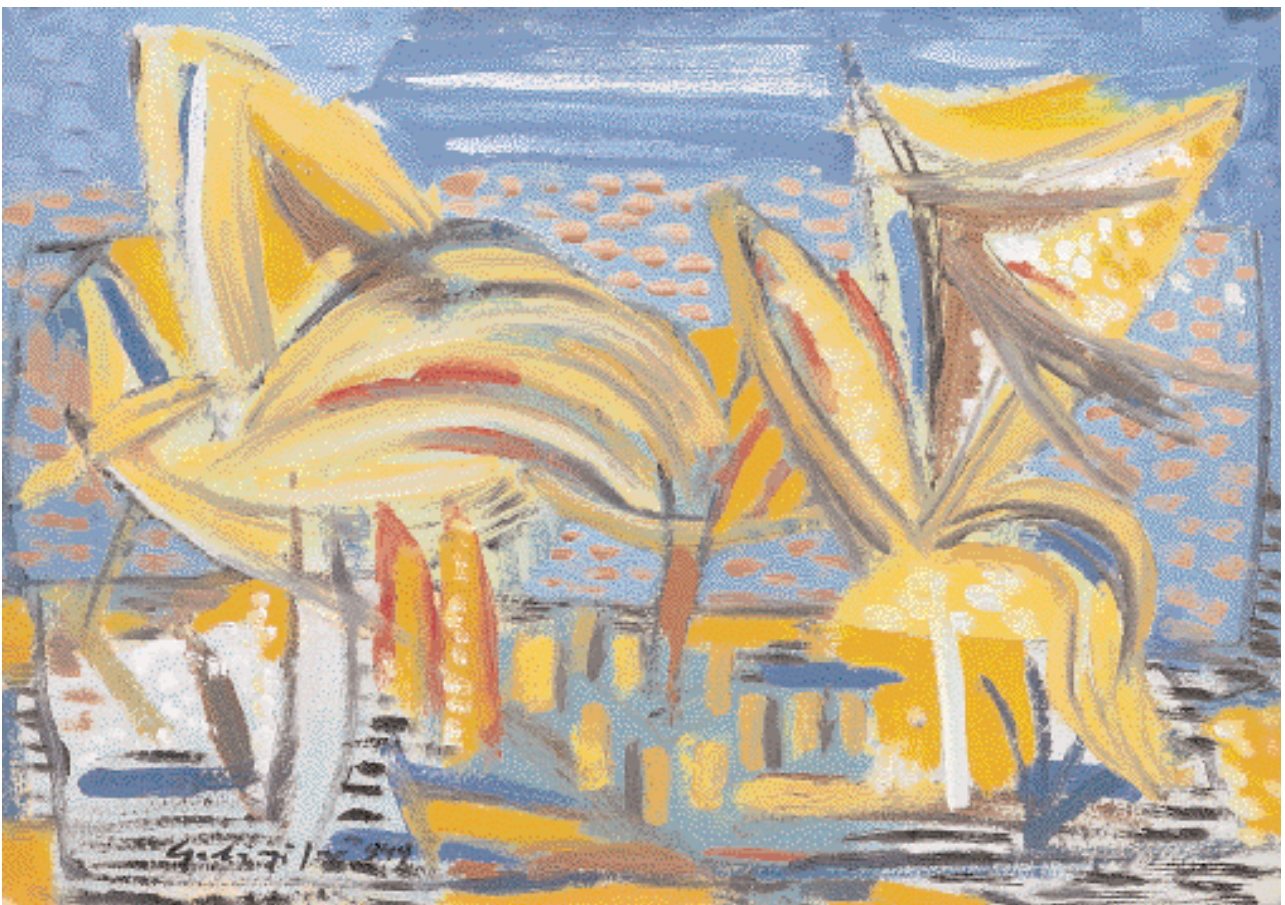
Színes fák – 1949 – vegyes technika, papír, 30 x 42,5 cm