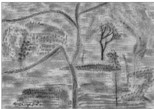
Fák X. – 1950 – kréta, papír, 30 x 43 cm

A természet újra és újra megérintette. A negyvenes évek elején festett tájak (Fekete táj 1942), a Kállai Ernő által megfogalmazott bioromantika gondolatköréhez kapcsolódtak. Vaszkó Erzsébettel rokonítható expreszszív, a „növényi formákat átíró” (Pataki G. – György P.), szinte monokróm, szenvedélyes festészete. Ezzel egy időben készítette vastag, fekete kontúrú gazdag gyümölcs-csendéleteit, melyeknél a kezdeti visszafogottabb színezést később a sötét kontúrokból kivillanó erőteljes