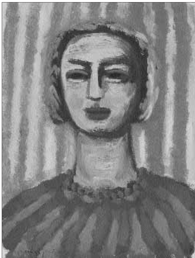
Női fej gyönggyel – 1954 – olaj, karton, 42 x 30 cm