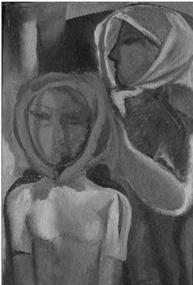
Drégelypalánki lányok – 1936 körül – olaj, vászon, 85 x 60 cm

tában látni. Ebben az esetben válik érthetővé, a „kerülő út” metaforája, egyúttal nem elhanyagolható momentum, hogy az 1948-as Ernst múzeumi gyűjteményes kiállításán a Békásmegyeren készült új művek mellett, mappában őrzött párizsi akvarelljeiből is bemutatott néhányat. Az időbeli eltolódásra Körner Éva közvetlenül a festő halála után írt tanulmányában már felhívta a figyelmet: „A természet elevensége és a konstruált képiség együttes jelenléte már e kezdeti műveknek (t.i. a párizsi akvarelleknek K. A.) is tulajdonsága – a későbbiekben ez az együttes némileg módosul, hol az egyik, hol a másik oldalra billen a mérleg – míg az utolsó tíz esztendő termésében, amely méltán tekinthető a kiteljesedésnek, ismét egyensúlyba kerül.” 3