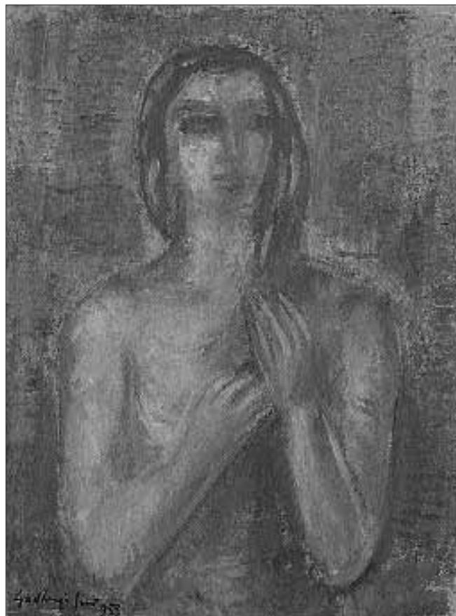
Fésülködő (Vénusz) – 1953 – olaj, vászon, 80 x 60 cm