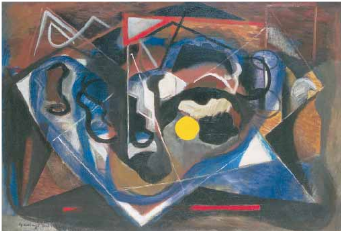
Kompozíció I. – 1930-as évek, olaj, vászon, 80 x 100 cm