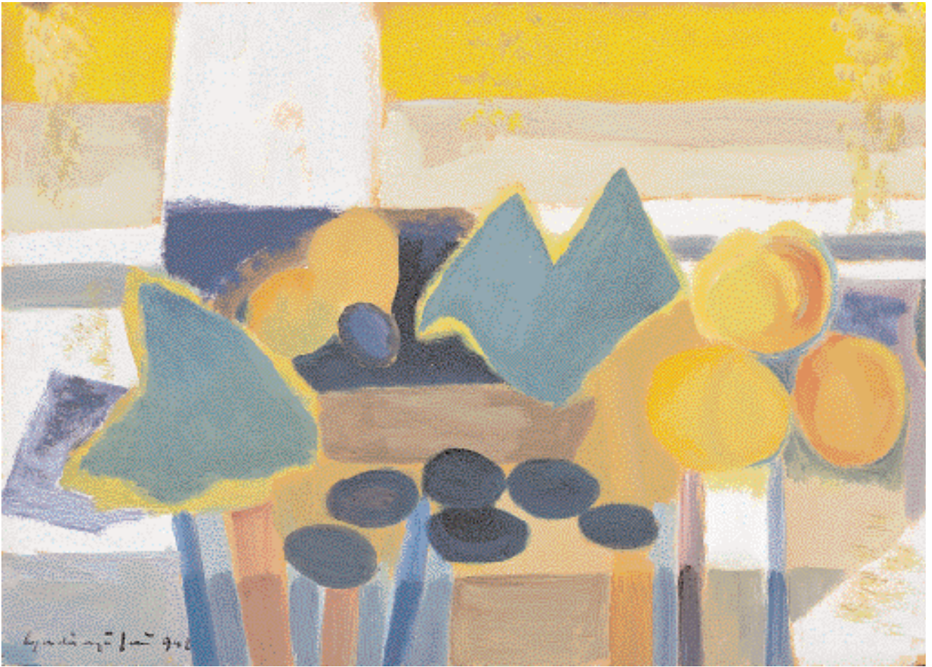
Csendélet szilvával, barackkal – 1948 – vegyes technika, papír, 30 x 42 cm