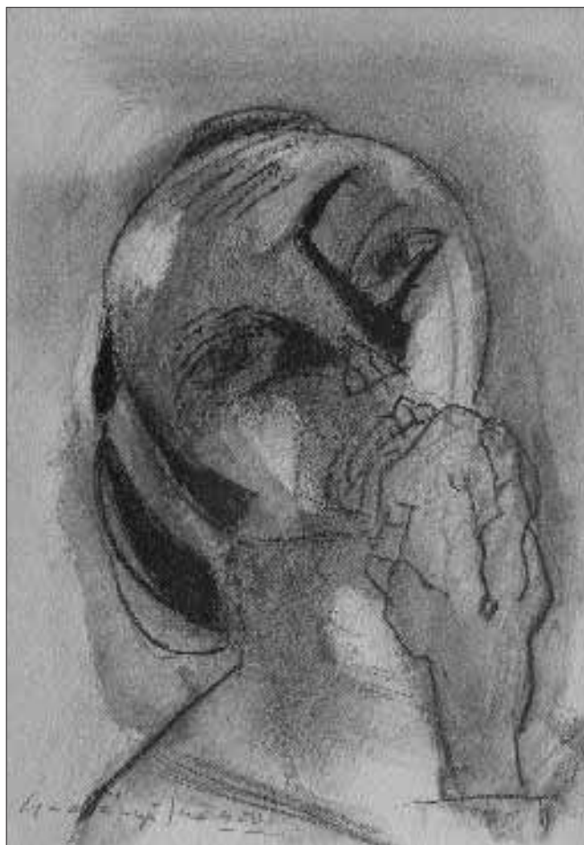
Almaevő – 1950 – akvarell, szén, pasztell, papír, 31 x 21,5 cm

színek gazdagították, hogy 1946-ra teljesen eluralkodjanak a felületen. A jellegzetes felülnézet, a dekoratív ornamentális a párizsi iskola két háború közötti, a kubizmus elemeit elsősorban dekoratív elemként alkalmazó könnyed festőiségét idézi fel. A kiszínesedés, kivilágosodás egyfajta optimizmussal társult. Az 1945-ben festett Új műzsa várakozással teli felszabadultságot mutat. A két háború között Iparostanonc iskolában tanító Gadányi Jenőt végre hozzá méltó megtiszteltetés érte, az Iparművészeti Főiskola tanárává kérték fel. Sajnos öröme nem tartott sokáig, 1949-ben elbocsátották állásából.