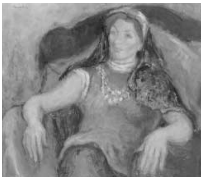
Lilaruhás nő – 1970-es évek – olaj, farost, 60x70 cm