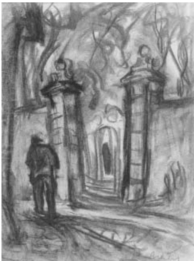
Szentendrei kapu – 1930-as évek – szén, papír, 29,5x22

(A művésztől származó idézetek megjelentek: Gráber Margit: Emlékezések könyve – Gondolat Kiadó Budapest, 1991)