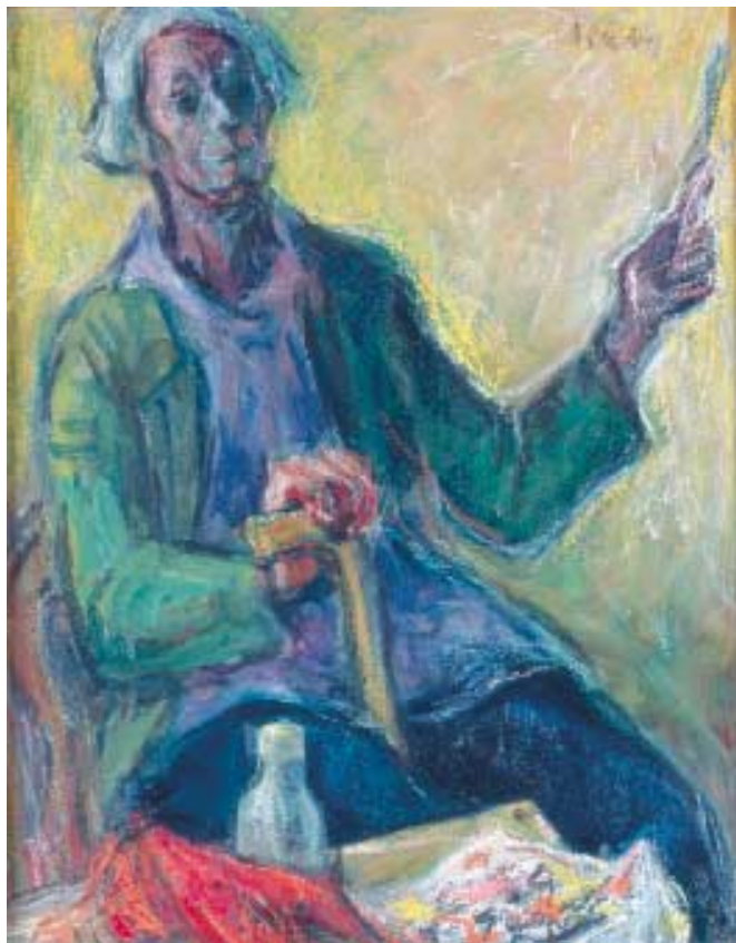
Önarckép – 1980 – olaj, pasztell kartonon, 60x47 cm