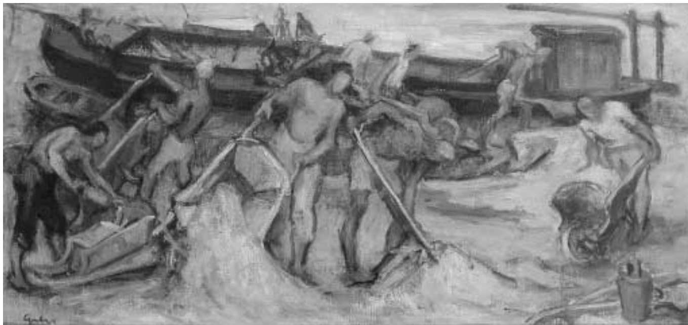
Útéptés – 1950 körül – olaj, vászon, 50x100 cm