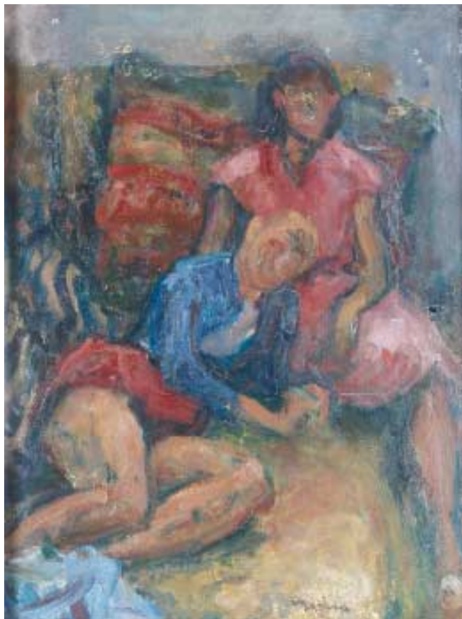
Szerelmesek – 1940-es évek – olaj, vászon kartonon, 65x50 cm