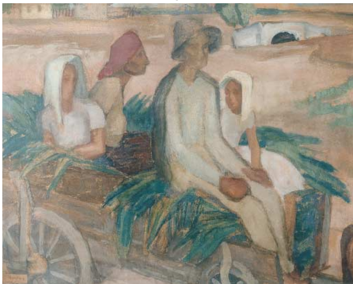
Szekéren – 1933 – tempera, karton, 58x78 cm