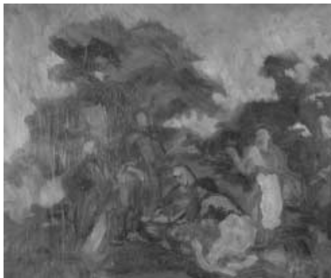
Gyümölcsszedők – 1916, olaj, karton, 35x40 cm