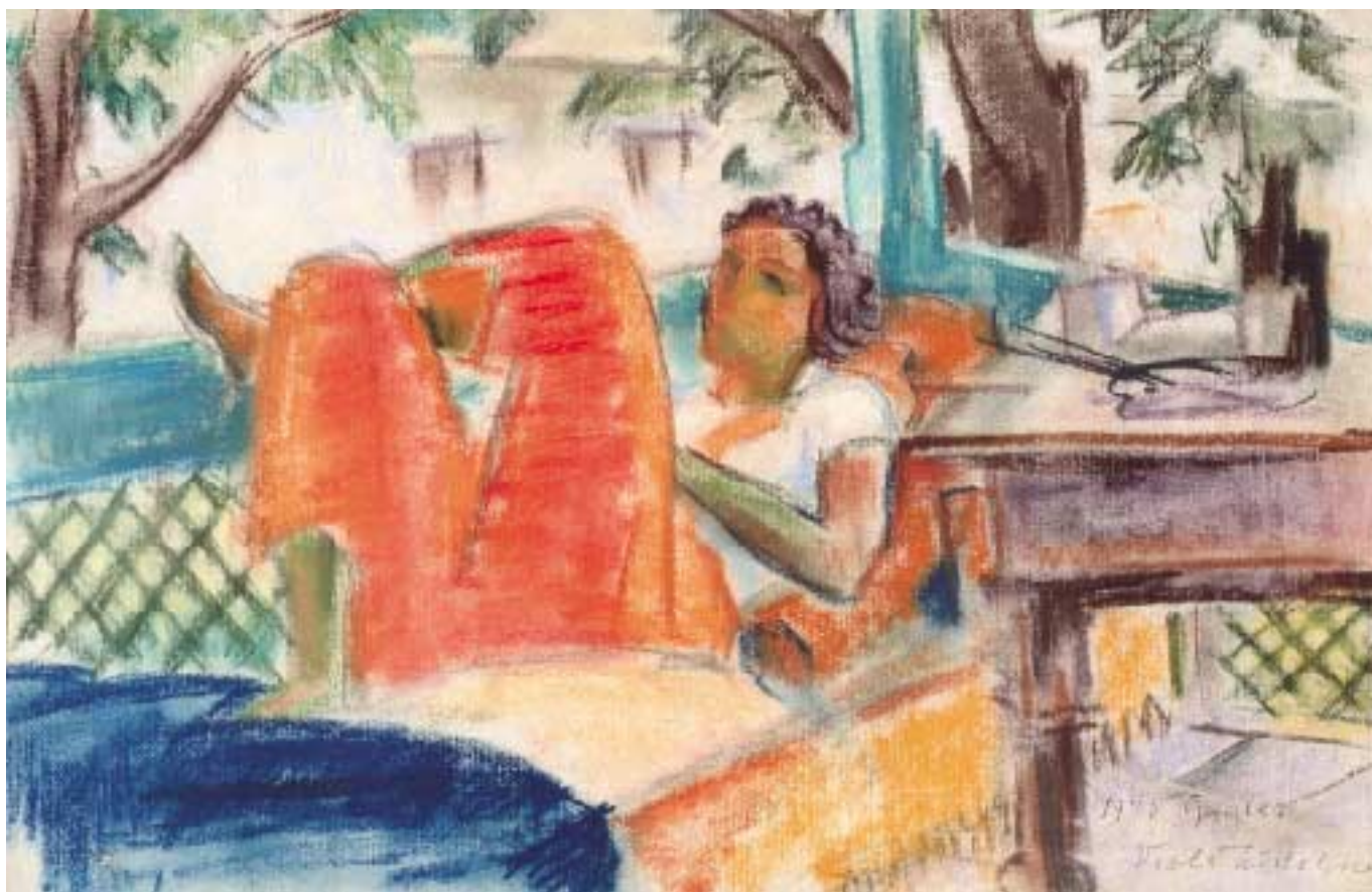
Pirosnadrágos nő II. – 1933 – pasztell, karton, 30x47 cm