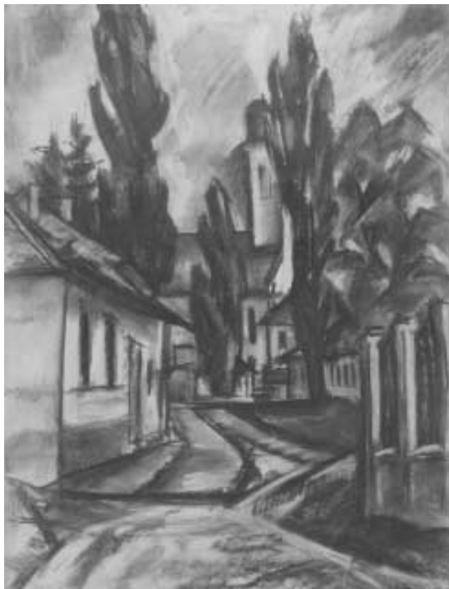
Nagybányai utca – 1920-as évek – szén, papír, 62x46,5 cm

A grafika volt Gráber Margit művészetének egyik meghatározó műfaja, felvidéki és németországi tartózkodásának idején is. Kezdetől fogva vallotta, hogy a legmodernebb festői irányzat is csak a rajztudás tökéletes elsajátításával közölhet hitelesen. Ez hozzátartozik a mű hűségéhez. Véleménye szerint a természetelvű festészetben a rajz annyi, mint íróember számára a gondolat. Ezért a lényeges jegyeket hangsúlyozva, elhagyja a natura esetlegességeit. Mondanivalójában, ember- és természetközpontság tekintetében mindvégig következetes volt.