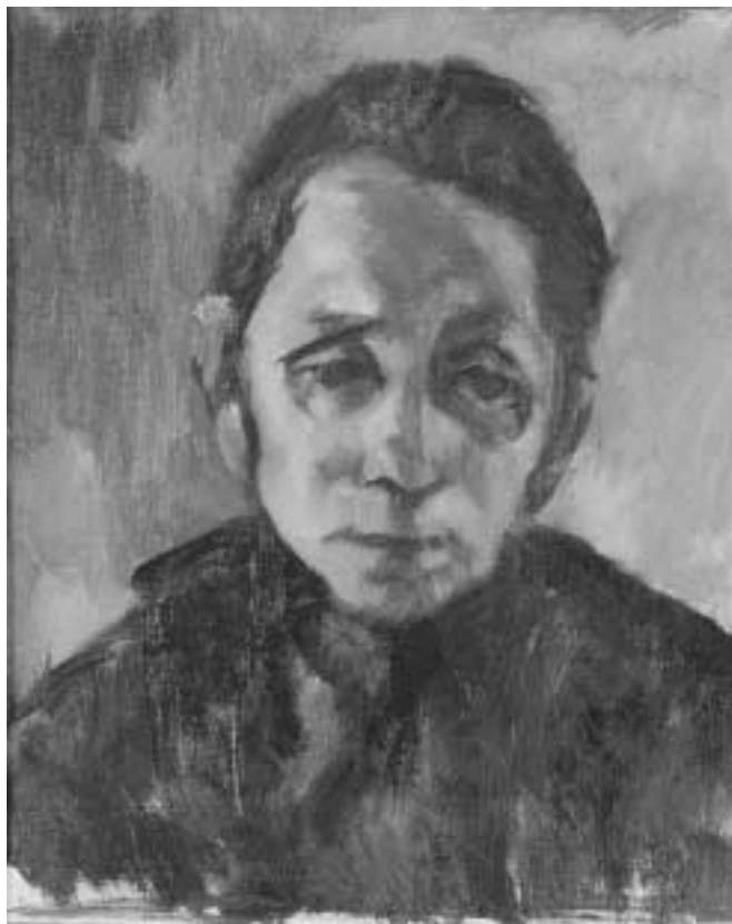
Anyám – 1930-as évek eleje, – olaj, vászon, 29x23 cm

egy mozdulatábrázolás és ritmusos cselekvések sorozata. Számptalan változatban, szemlélődően közelített a témáihoz, amint azt a Szekéren is bizonyítja. Kitűnő színérzékel, olajban, pasztellban és rajzokon elevenítette meg a nagybányai, szentendrei és budapesti piacokon portékájukat kínáló kofákat is.