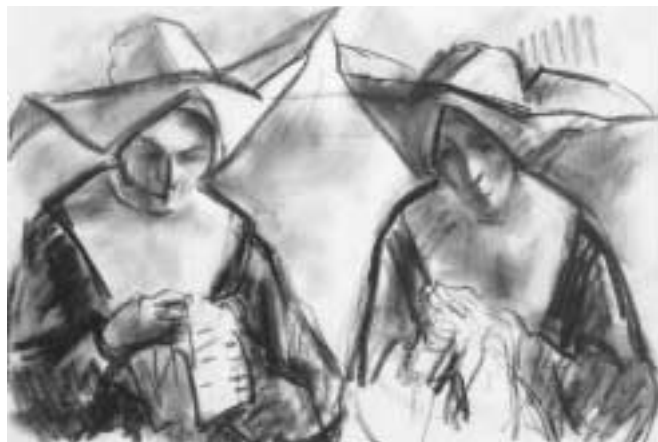
Apácák – 1946 – szén, papír, 24x32,5 cm