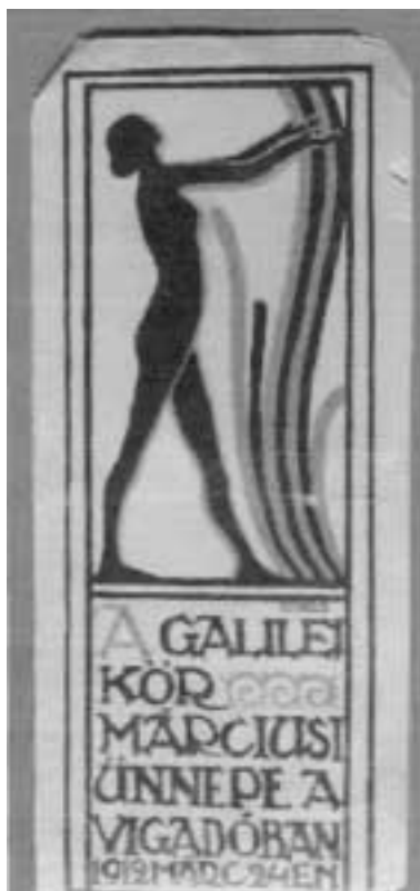
A Galilei-kör meghívója

A festő 1916-ban, fiatalon került a kecskeméti művésztelepre, ahol Iványi Grünwald Béla tanítványaként dolgozott, aki mint vezető tanár a legteljesebb művészi szabadságot biztosította.