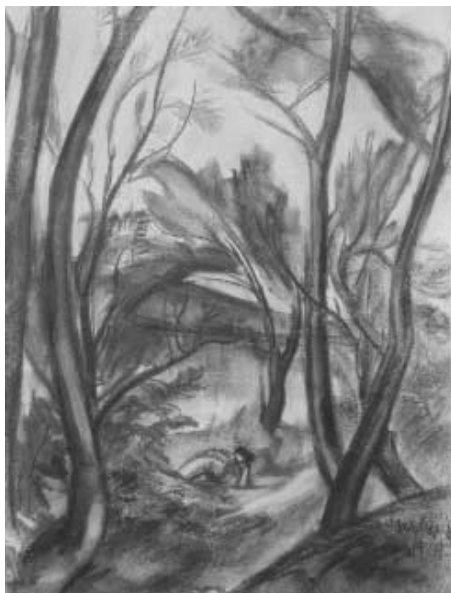
Erdőrészlet – 1929 – szén, papír, 62x43 cm