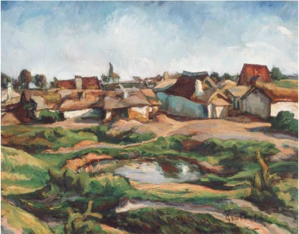
Kecskemét – 1910-es évek – olaj, karton, 58x72,5 cm