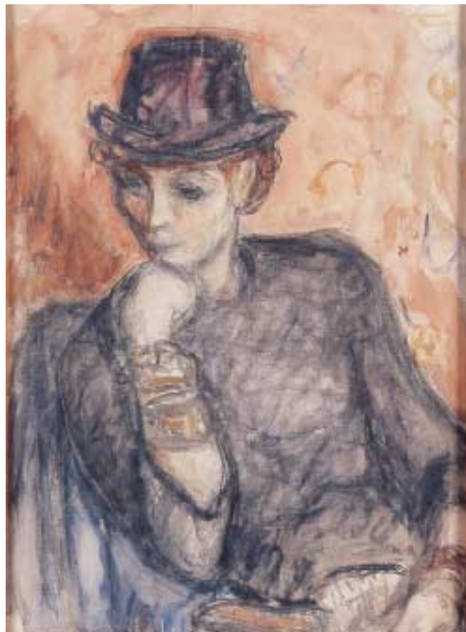
Kalapos hölgy – 1960-as évek – pasztell, papír, 65x47 cm