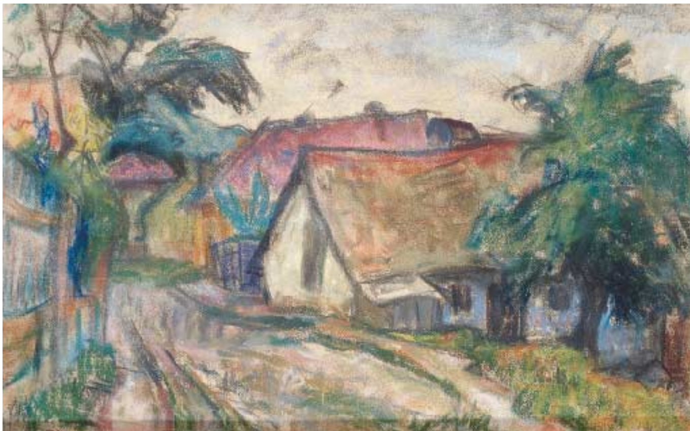
Szentendrei utca – 1940 – pasztell, papír, 30x46,5 cm