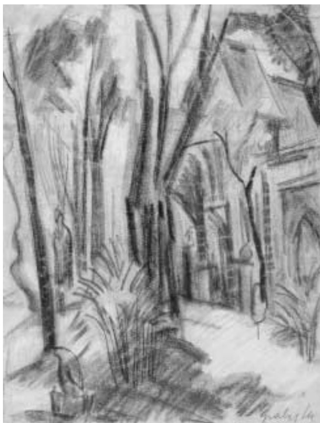
Ház előtt – 1940-es évek – pasztell, papír, 29x21 cm