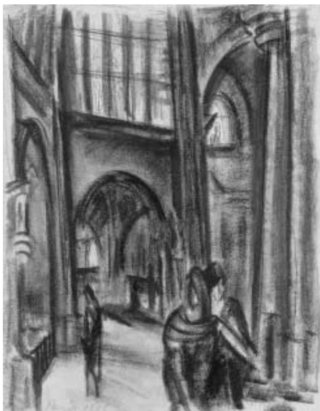
Saint Étienne du Mont – 1926, szén, papír, 26,5x20,5 cm