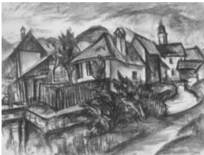
Zazar-parti házak – 1920-as évek – szén, papír, 47x63 cm